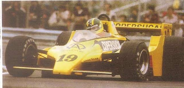
Alex Dias Ribeiro como piloto do Medical Car, com José Carlos Pace e Emerson Fittipaldi, e pilotando o Copersucar na Fórmula 1